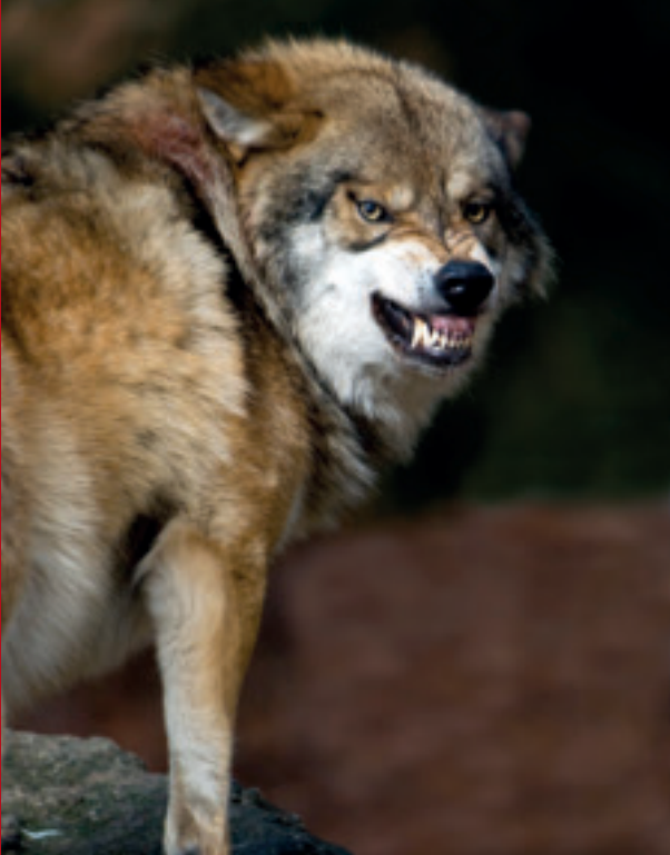
Wolf.