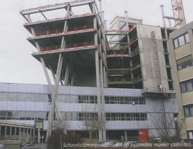
Schoorkolommen realiseren op bijzondere manier stabiliteit